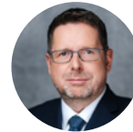
Stephan Stracke, MdB

Stv. Vorsitzender CDU/ CSU-Bundestagsfraktion