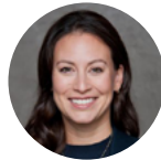
Caroline Bosbach, MdB

Bundesministerium für Wirtschaft und Energie