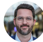
Dr. Philipp Rottwilm, MdB